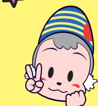
延岡市のご当地キャラクターのほるくん